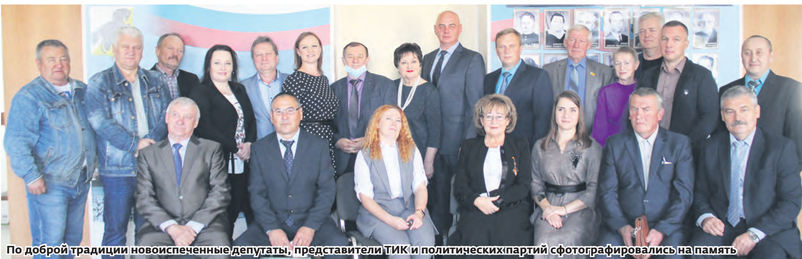
По доброй традиции новоиспеченные депутаты, представители ТИК и политических партий сфотографировались на память