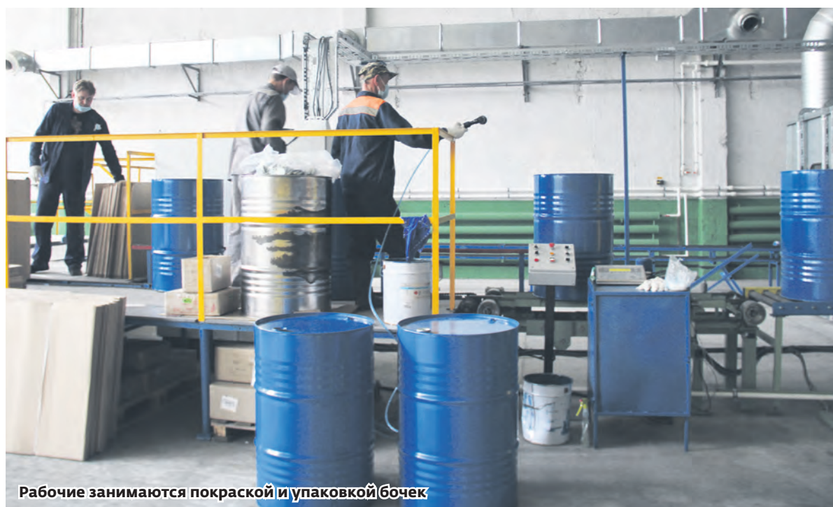
Рабочие занимаются покраской и упаковкой бочек

На одном из этажей пятиэтажного административного здания оборудована столовая, где сотрудников кормят бесплатным горячим обедом, закупая его в ближайшем кафе. На этом же этаже просторные душевые, гардеробные и другие санитарно-бытовые помещения. Здесь работающий персонал может принять душ и переодеться в рабочую форму, которая также предоставляется бесплатно. Полы и стены облицованы влагостойкими, светлых тонов материалами, в некоторых помещениях освещение снабжено датчиками движения, осветительные приборы включаются по мере необходимости, реагируя на приближение человека. Всё это, пусть внешний,