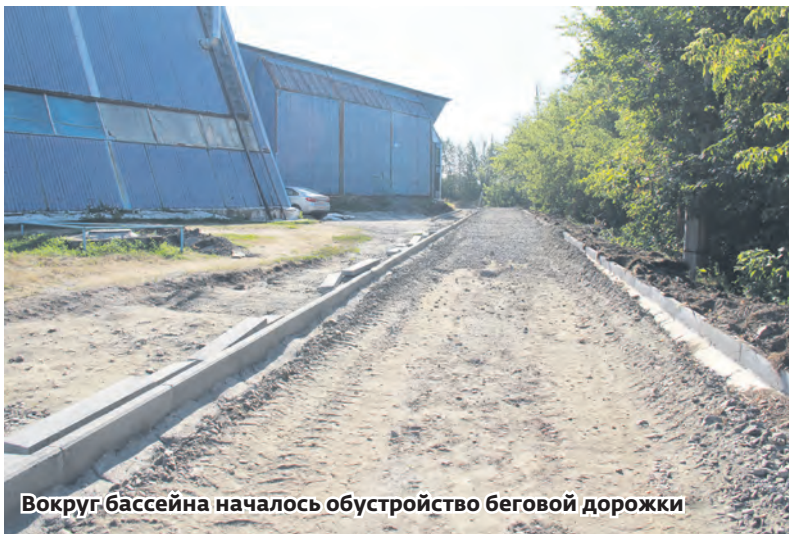
Вокруг бассейна началось обустройство беговой дорожки

— Сегодня администрация района основные усилия направляет на исполнение тех контрактов, которые уже заключены по итогам торгов: завершается ремонт кровли ДК им. Захарова, ведутся земляные работы по строительству сквера «Молодежный», продолжается газификация в Каслях, Маукке, Вишневогорске, Огневском, Щербаковке. Подрядчик приступил к выполнению дорожных работ в сельских поселениях. Город ведет