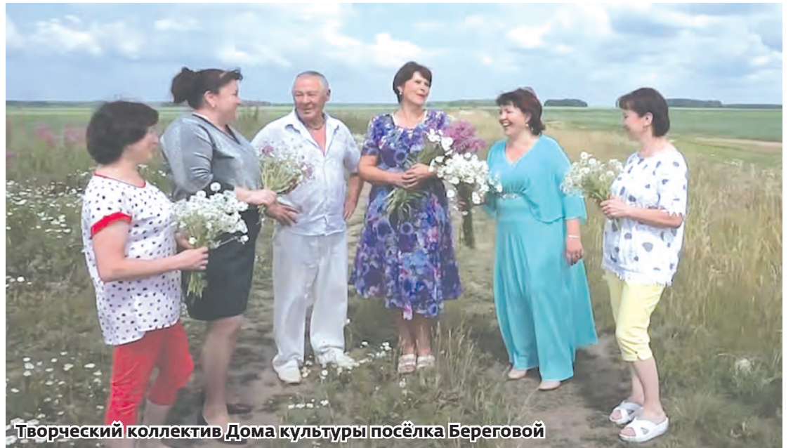
Творческий коллектив Дома культуры поселка Береговой