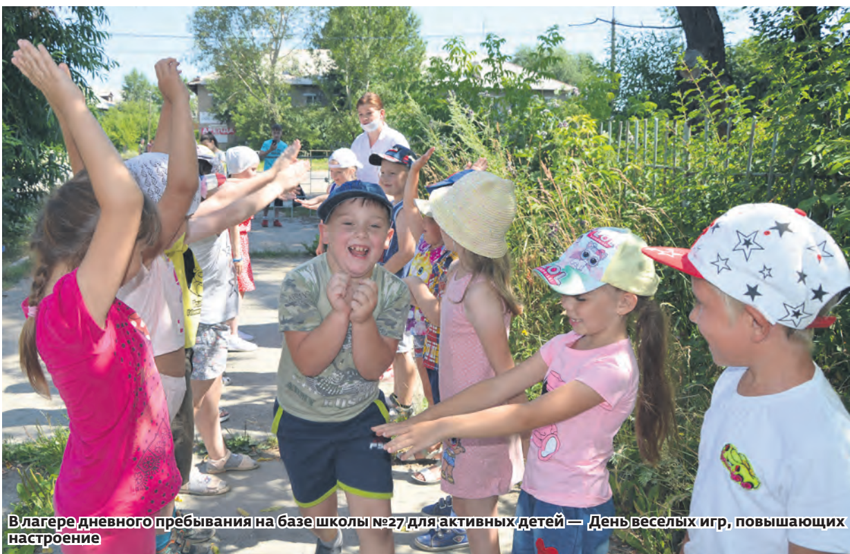
В лагере дневного пребывания на базе школы №27 для активных детей — День веселых игр, повышающих настроение

Более 300 ребят Каслинского района отдохнут в дневных школьных оздоровительных лагерях