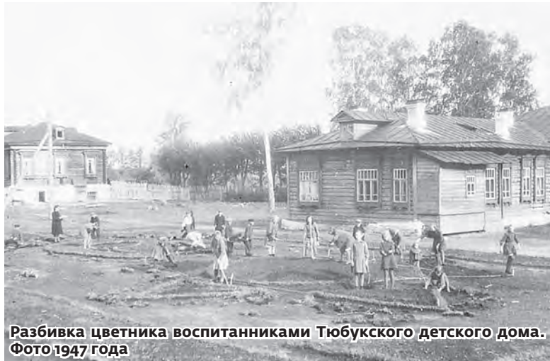
Разбивка цветника воспитанниками Тюбукского детского дома. Фото 1947 года