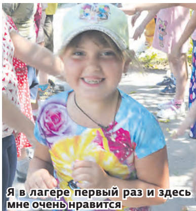
Я в лагере первый раз и здесь мне очень нравится