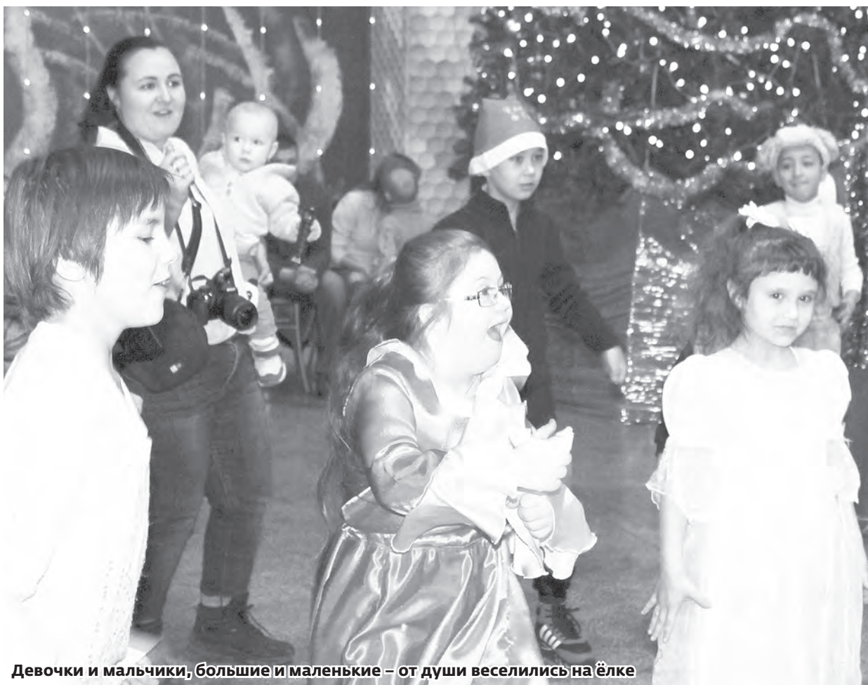
Девочки и мальчики, большие и маленькие – от души веселились на ёлке

На празднике побывало 35 «особенных» детей