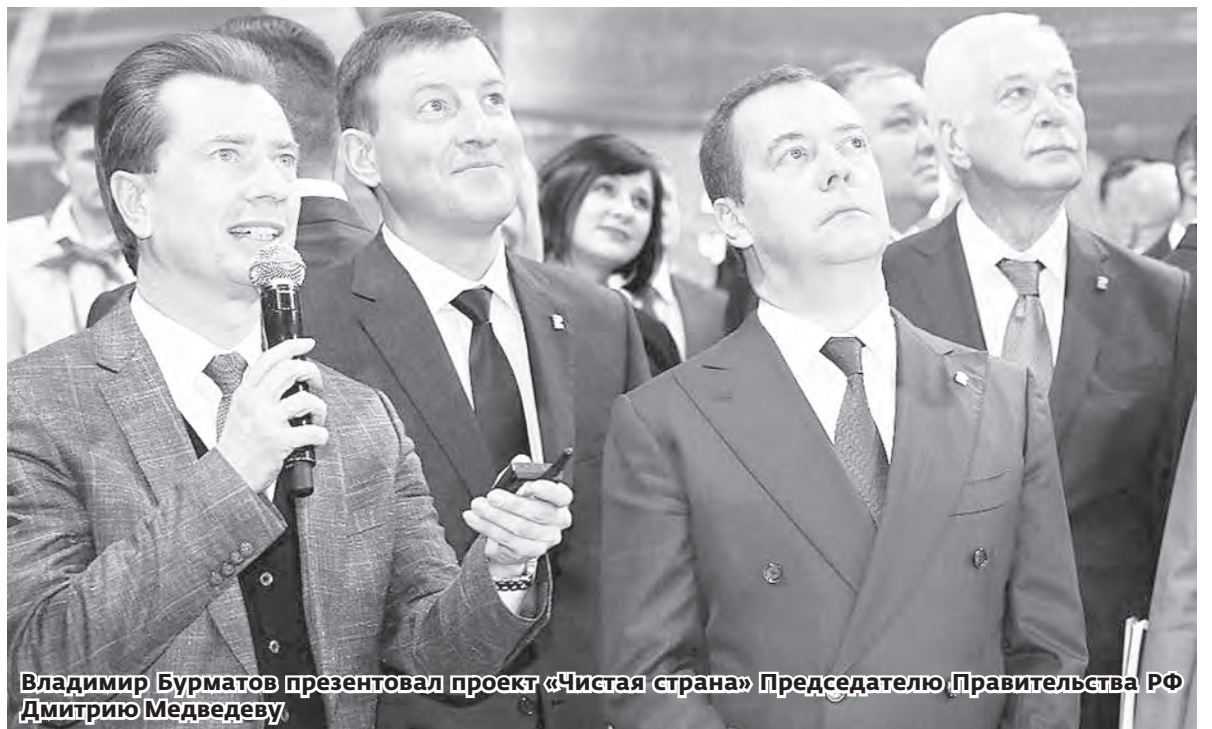
Владимир Бурматов презентует проект «Чистая страна» Председателю Правительства РФ Дмитрию Медведеву

Парламентарий отметил, что направление «Чистая вода» тоже имеет особое значение для Челябинской области, которая на сегодняшний день не является участником