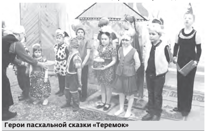
Герои пасхальной сказки «Теремок»

Второй год мы в школе изучаем православную культуру. Чаще улыбаемся друг другу, стремимся к добру, проявляем заботу о маленьких и пожилых людях. От этого мы становимся счастливыми.