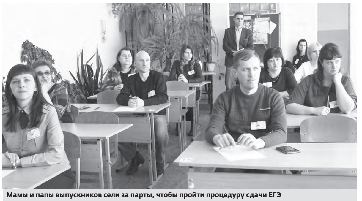
Мамы и папы выпускников сели за парты, чтобы пройти процедуру сдачи ЕГЭ

Были в точности соблюдены все этапы, которые обычно проходят на ЕГЭ выпускники. В класс запускали по одному, объявляя по списку фамилии и место, которое должен занять участник (место определяется автоматической рассадкой в день экзамена). С собой можно было пронести только паспорт и черную гелевую ручку. В кабинете сидел наблюдатель и работали видеокамеры. После того, как все заняли свои места, организаторы рассказали о ходе и особенностях экзамена по русскому языку, проинструктировали участников о правилах заполнения бланков регистрации. Затем вскрыли конверт, в котором был прислан диск с КИМами (контрольно-измерительные материалы). Тут же, в аудитории, распечатали одиннадцать экземпляров полного комплекта экзаменационных материалов и раздали каждому экзаменуемому. Объяснили, как правильно заполнить бланки, после чего дали отсчет времени, отведённого на выполнение заданий. В нашем случае это было полчаса. За это время нужно успеть выполнить два блока тестовых заданий. Родителям в первой части было предложено 8 вопросов. Вторая, наиболее сложная часть — это сочинение. Не думаю, что кто-то успел его