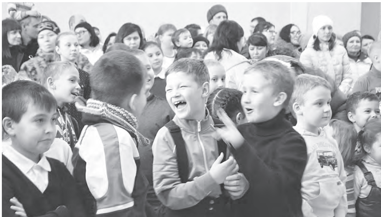
Дети открыто выражали свои эмоции во время игровой программы

Средства с благотворительной ярмарки пошли на подарки детям с ограниченными возможностями здоровья