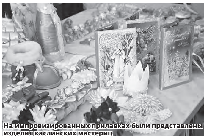
На импровизированных прилавках были представлены изделия каслинских мастериц