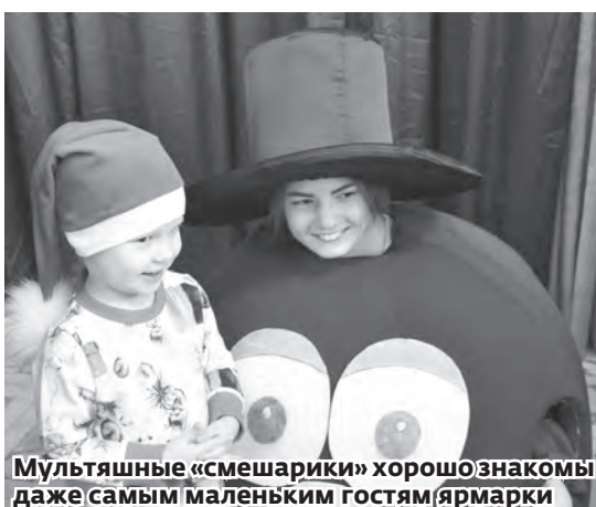
Мультяшные «смешарики» хорошо знакомы даже самым маленьким гостям ярмарки