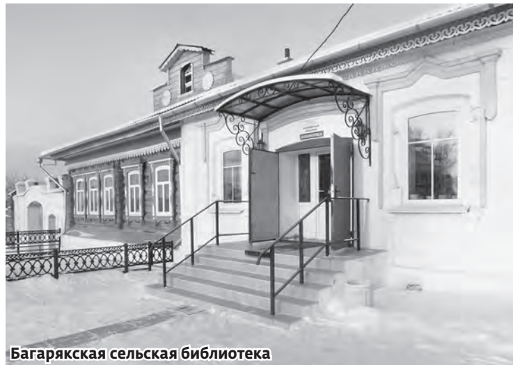
Багарякская сельская библиотека

По просьбе жителей села С. С. ШКЛЯЕВА, депутат сельского поселения