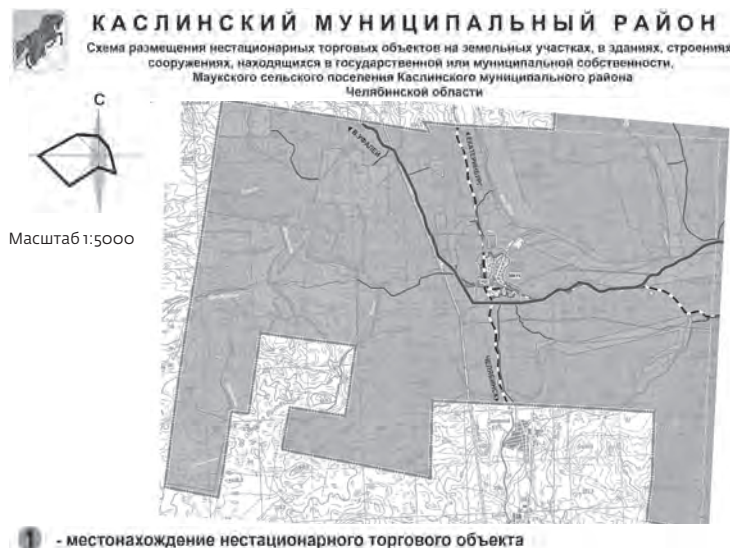
Схема административно-территориального деления района