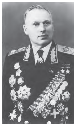
Маршал К. К. Рокоссовский. Фотография 1960-х гг.