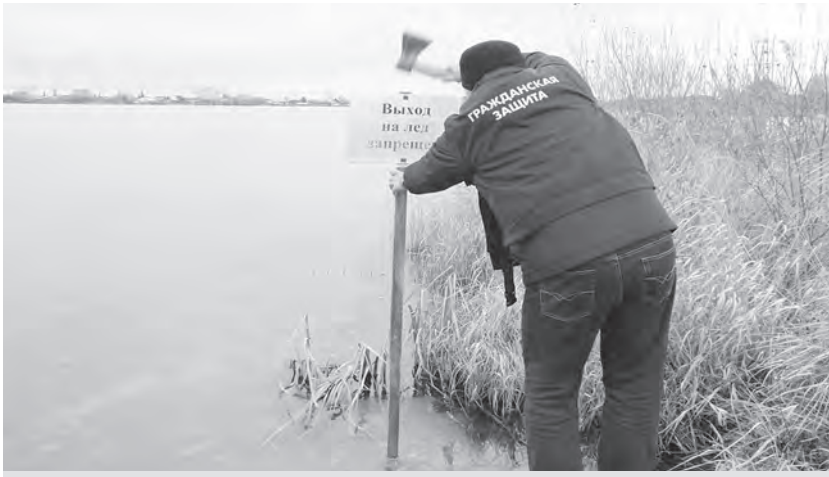
Сотрудник гражданской защиты устанавливает запрещающий знак

Не поддавайтесь панике. Не надо барахтаться и наваливаться всем телом на тонкую кромку