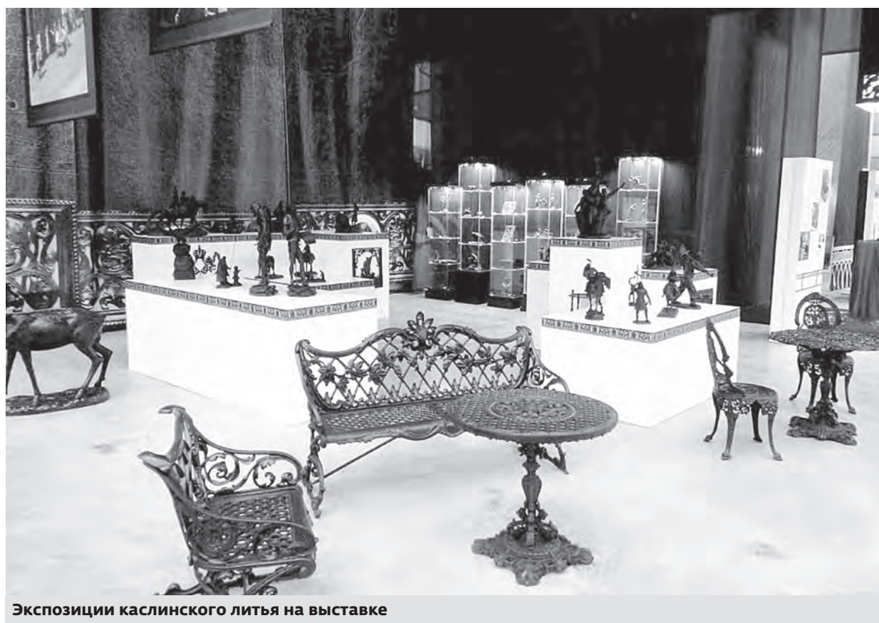
Экспозиции каслинского литья на выставке

Каслинское литье показали на форуме межрегионального сотрудничества России и Казахстана