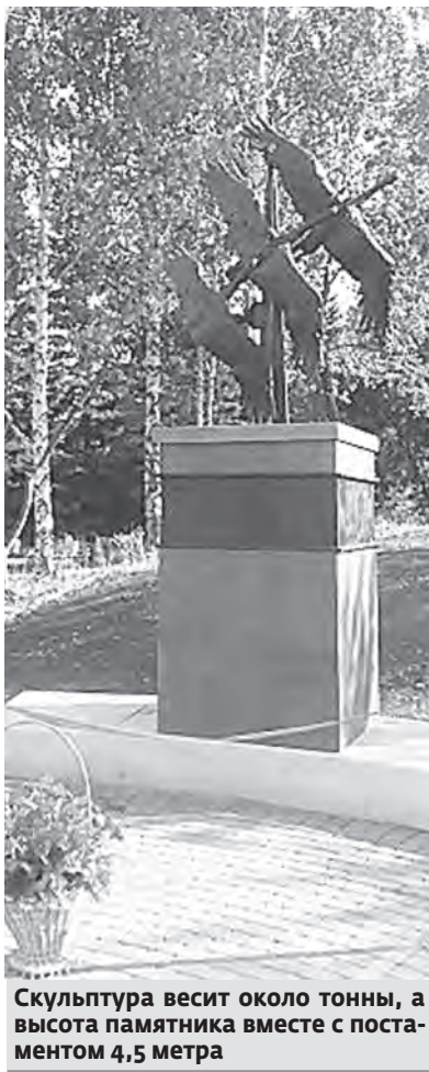
Скульптура весит около тонны, а высота памятника вместе с постаментом 4,5 метра