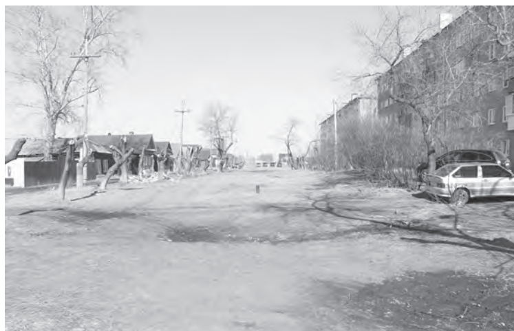
Сегодня заброшенная территория городского сквера используется для проезда частных автомобилей и их несанкционированной парковки