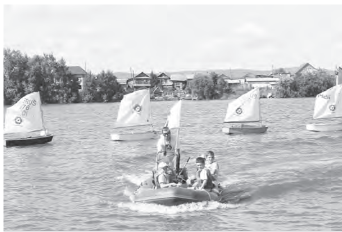
Яхтсмены из Снежинска