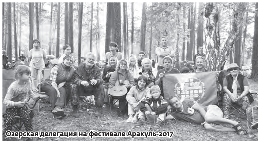
Озерская делегация на фестивале Аракуль-2017