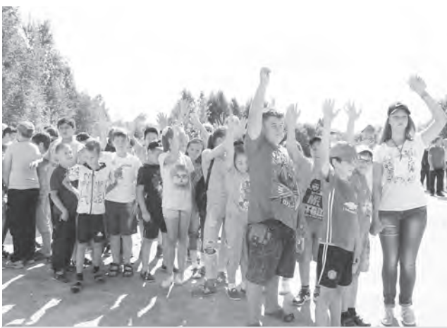
Команда каслинцев к началу игры готова