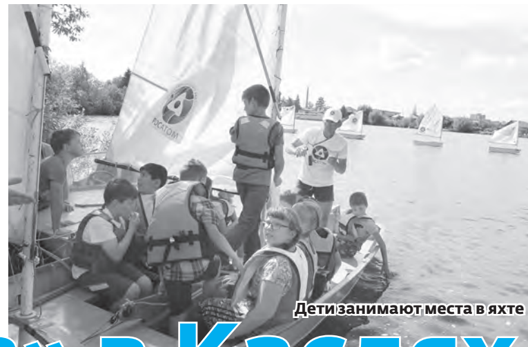
Дети занимают места в яхте