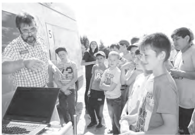
Специалист ПО «Маяк» демонстрирует работу приборов