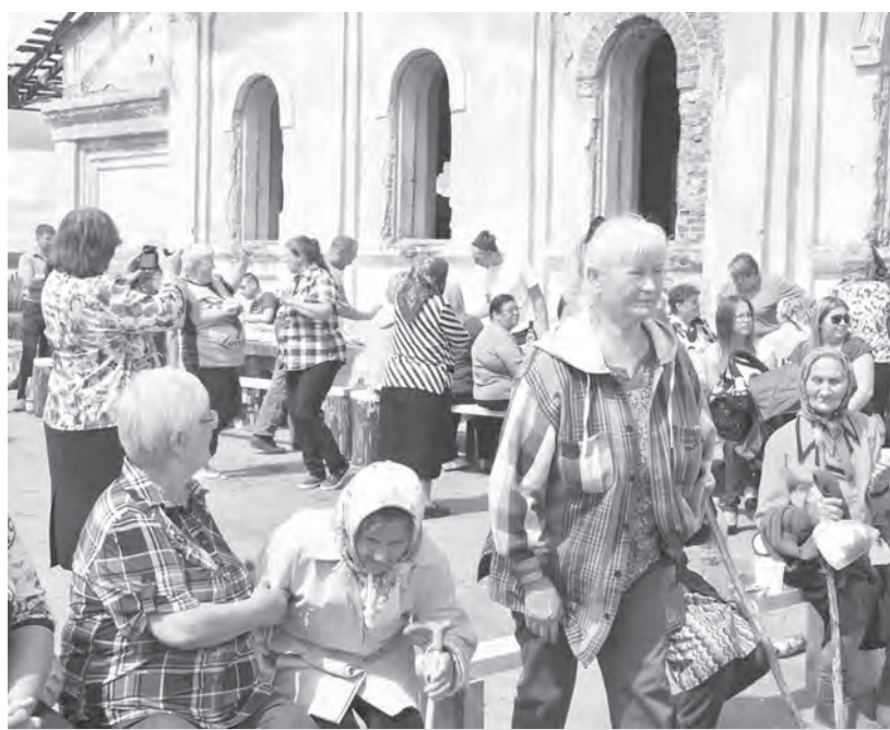
На праздник села пришли и стар и млад

Зрителей порадовали разнообразные номера концертной программы, в которой приняли участие не только взрослые, но и дети. Мы благодарим за участие в концертной программе: во-