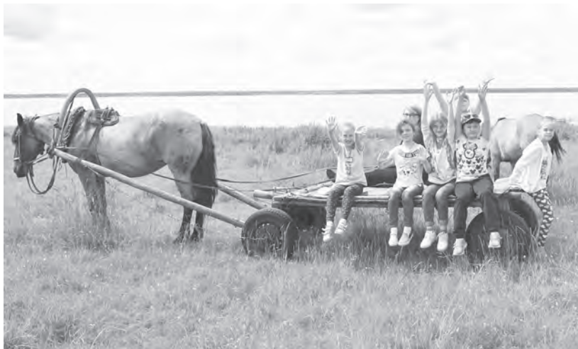
Прокатиться на телеге, запряженной лошадей, — большое удовольствие для деревенских ребятишек