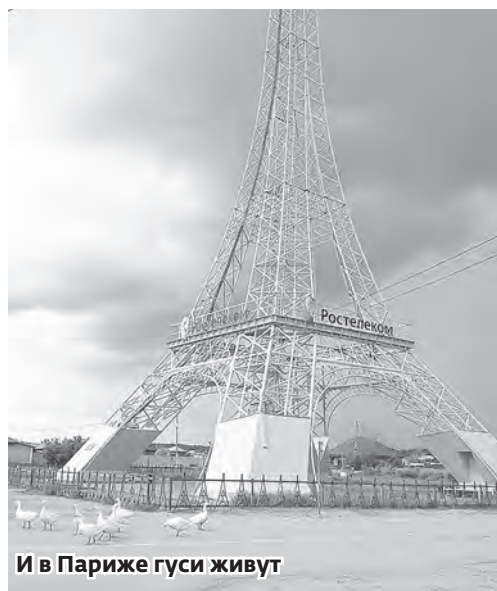
И в Париже гуси живут