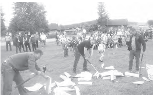
Мужчины соревнуются в колке дров