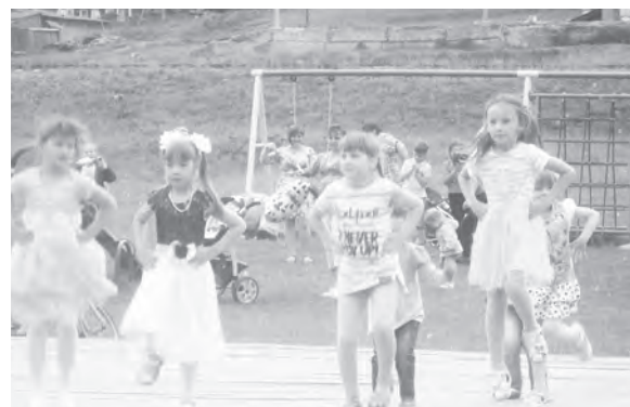
Воспитанники детского сада исполняют танец «Мы – маленькие звёзды»