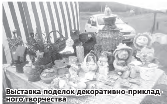
Выставка поделок декоративно-прикладного творчества

про семью. Танцевали школьницы и детки из детсада. Разные конкурсы тоже украсили и оживили праздник.