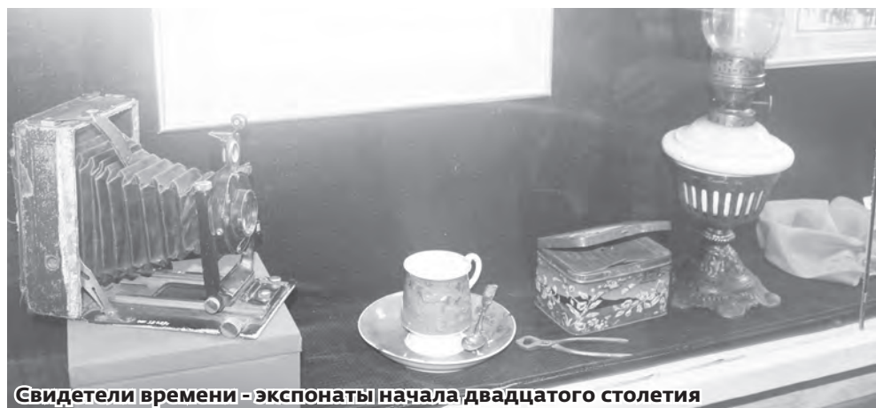
Свидетели времени - экспонаты начала двадцатого столетия