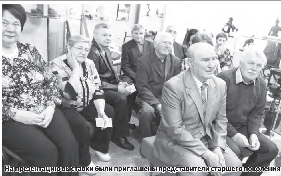
На презентацию выставки были приглашены представители старшего поколения

Но, как известно, творцами истории являются люди, без их участия не строятся города, не развивается наука, не созда-