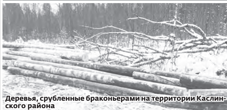
Деревья, срубленные браконьерами на территории Каслинского района

Каждое незаконно срубленное дерево обернется штрафом и не только