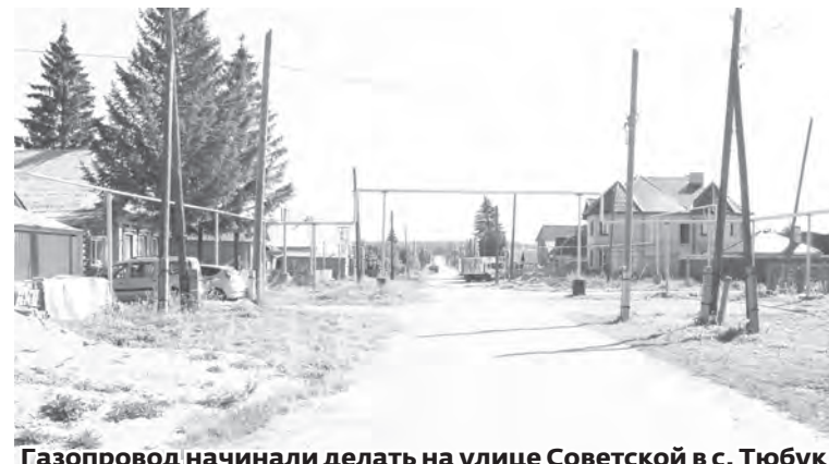
Газопровод начинали делать на улице Советской в с. Тюбук