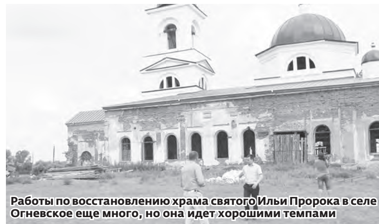
Работы по восстановлению храма святого Ильи Пророка в селе Огневское еще много, но она идет хорошими темпами