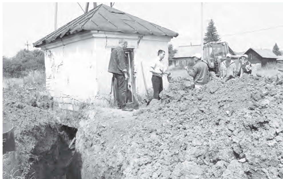
В день приезда в Багаряк глава района побывал на месте порыва водопровода. Коммунальная авария на несколько дней оставила без воды жителей улиц Лесная, 1 Мая, Тракторная, Павлова. Порыв ликвидировали, заменив старые трубы на пластиковые

Напомним, что с июля в районе начались информационные встречи главы Каслинского муниципального района с населением. Очередная встреча прошла в Огневском и Багарякском сельских поселениях. Освещая ситуацию в целом, в своих выступлениях глава делал акцент на тех аспектах, которые актуальны для конкретной территории.