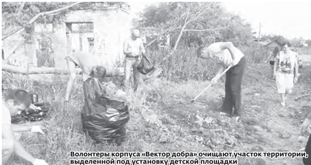
Волонтеры корпуса «Вектор добра» очищают участок территории, выделенной под установку детской площадки