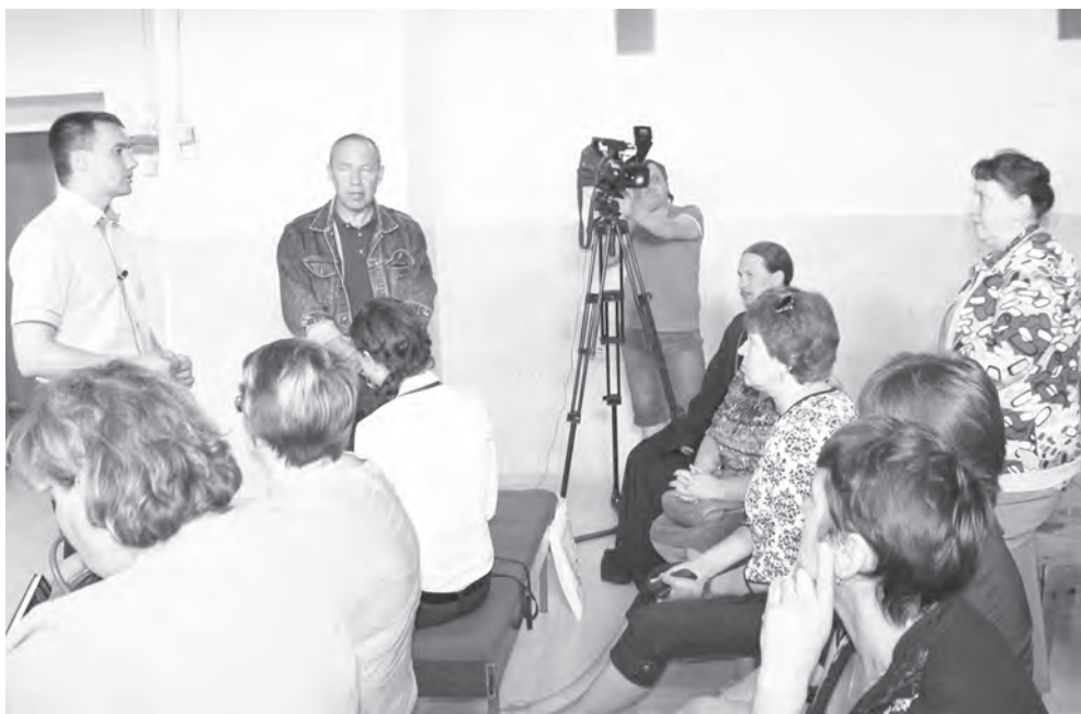
В ходе разговора с главой района багарякцы поднимали вопросы жилищно-коммунального хозяйства

Селяне высказали свои проблемы, задали наиболее волнующие вопросы, озвучили предложения