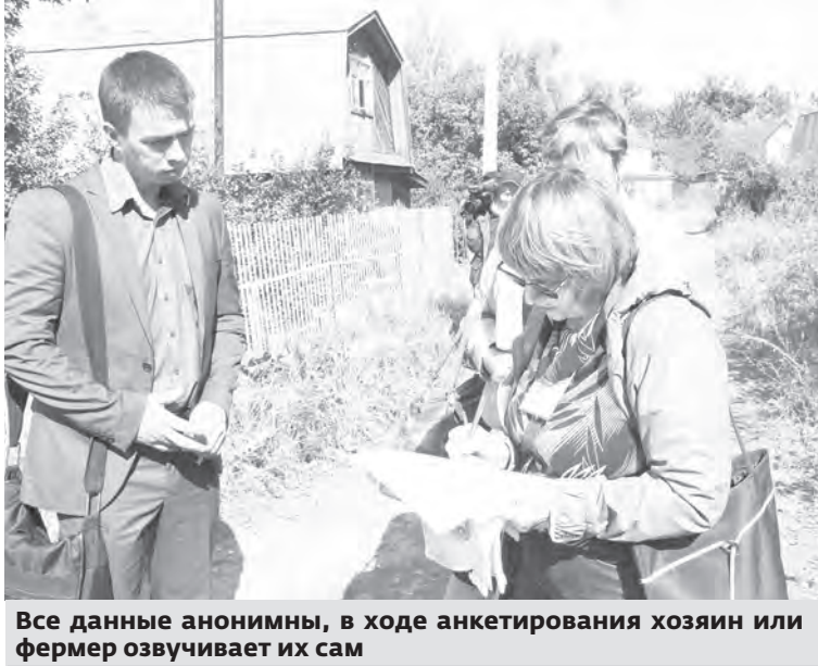
Все данные анонимны, в ходе анкетирования хозяин или фермер озвучивает их сам

С 1 июля по 15 августа проводится вторая Всероссийская сельскохозяйственная перепись, периодичность которой определена федеральным законом не реже, чем 1 раз в 10 лет.