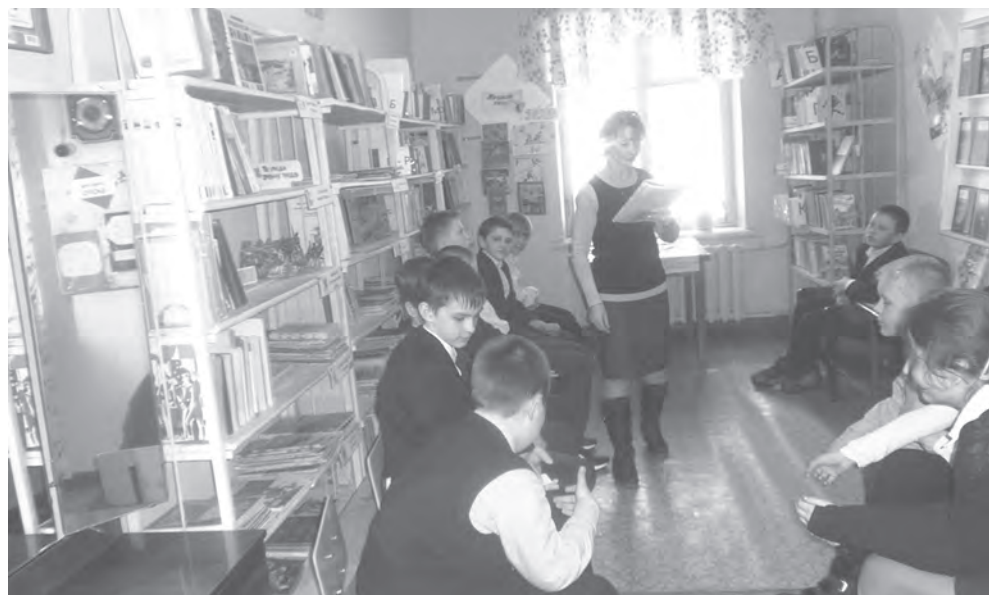
В зале библиотеки

О том, что и как они читают, помогают узнать и такие формы библиотечной работы, как литературные викторины и интеллектуальные игры. Библиоквест «Вперед, книголюбы!» был организован в детской библиотеке 3 марта. В этой увлекательной игре-поиске приняли участие пятиклассники Вишневогорской школы №37. Две команды соревновались в знании литературных произведений и их авторов, делая остановки на станциях «Литературная карусель», «Аптека для души», угадывали авторов телеграмм, побывали в «Музее забытых вещей», где нужно было назвать хозяина той или иной вещи. Нужно отметить, что ребята неплохо знают многих героев детских книг, резво декларируют