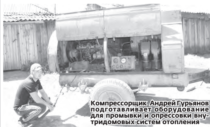
Компрессорщик Андрей Гурьянов подготавливает оборудование для промывки и опрессовки внутридомовых систем отопления