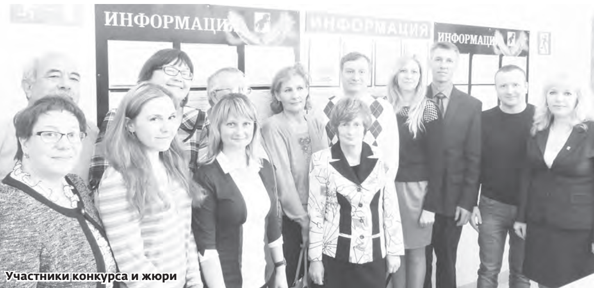
Участники конкурса и жюри