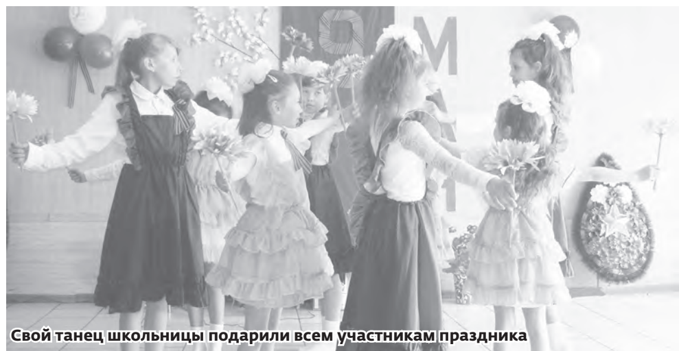
Свой танец школьницы подарили всем участникам праздника