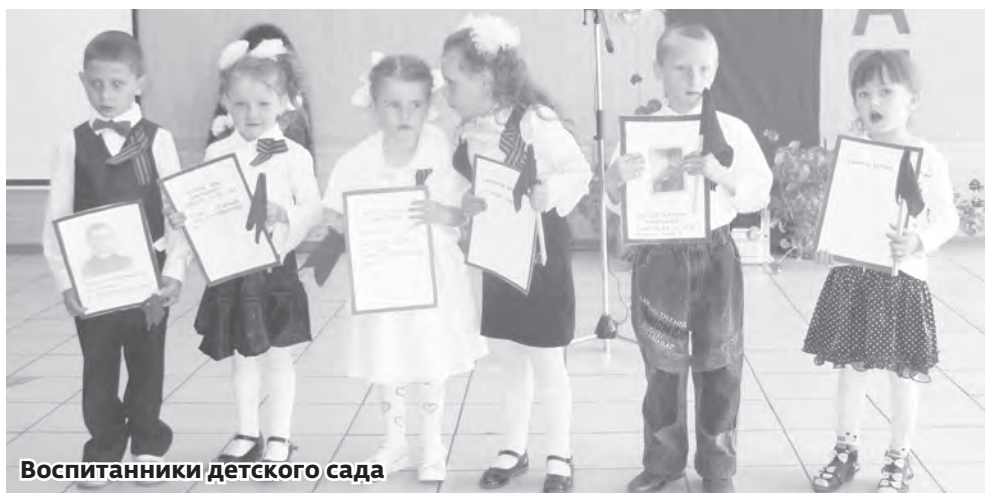
Воспитанники детского сада

ние концерта на сцене появился Бессмертный полк, который напомнил жителям села, что погибшие герои и живые ветераны останутся в памяти шабуровцев навсегда, а Бессмертный полк — бессмертная Россия.