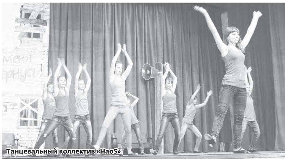
Танцевальный коллектив «Naos»