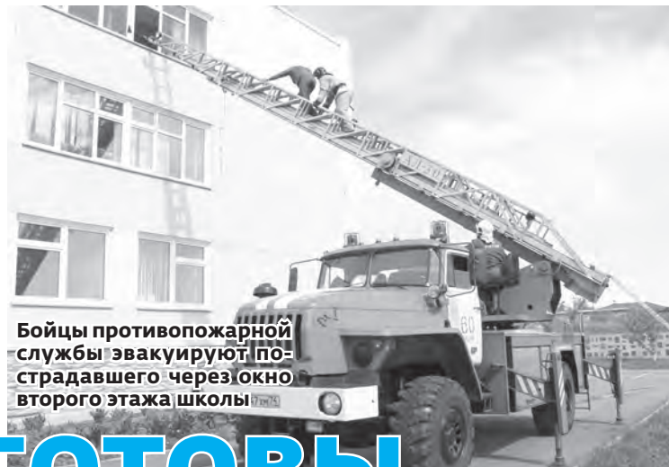
Бойцы противопожарной службы эвакуируют пострадавшего через окно второго этажа школы