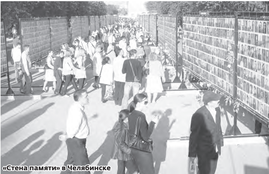
«Стена памяти» в Челябинске