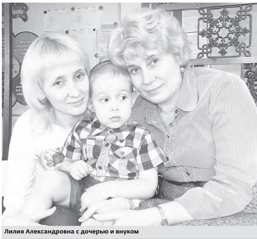
Лилия Александровна с дочерью и внуком

«Как и перед большинством подростков, в 17 лет, кажется, что перед тобой открыты все дороги, но выбрать нужно одну. Моя мама работала