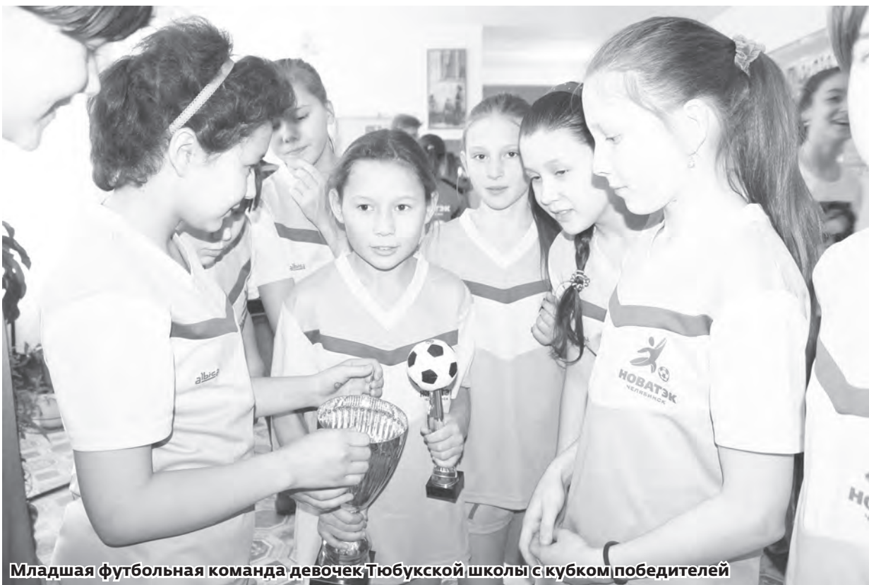
Младшая футбольная команда девочек Тюбукской школы с кубком победителей

Они так хотят: вместо поездки за рубеж — беговую дорожку