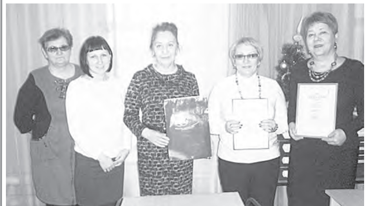
Коллектив центральной библиотеки

Завершился год празднования 70-летия Победы в Великой Отечественной войне. Подведены итоги областного конкурса «Патриотическое воспитание молодежи сквозь призму библиотеки средствами интернет-технологий», объявленного министерством культуры Челябинской области.