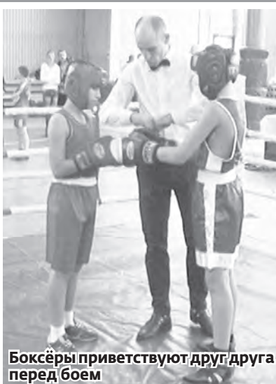
Боксёры приветствуют друг друга перед боем

Сто тридцать спортсменов съехались 10-11 декабря в г. Касли на традиционный турнир по боксу в честь Героя Советского Союза Валерия Востротина.