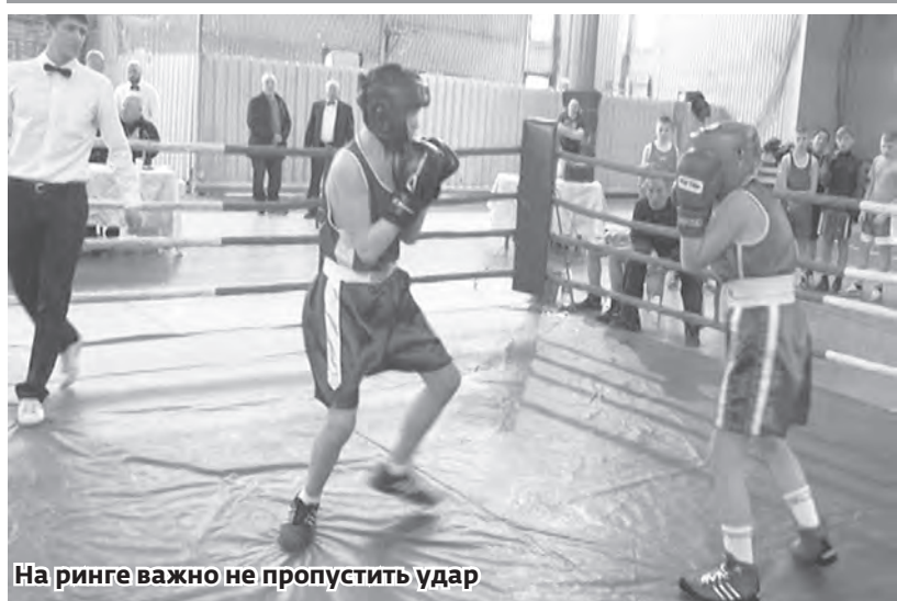
На ринге важно не пропустить удар

Каслинские боксёры выиграли семь финальных поединков