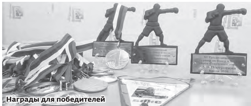
Награды для победителей