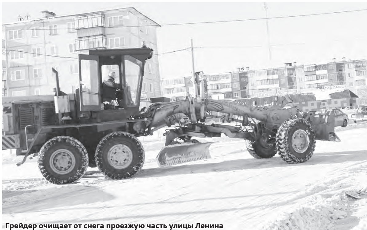
Грейдер очищает от снега проезжую часть улицы Ленина

Во второй половине дня в понедельник начались работы по наиболее протяжённым улицам: Красный фронт, Металлистов, Энгельса. Вчера работы были приостановлены из-за мороза. Как только температура воздуха повысится, техника