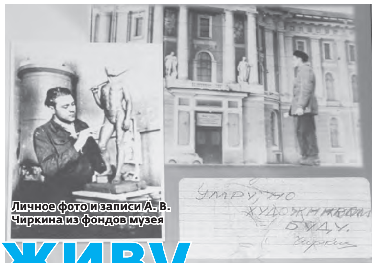
Личное фото и записи А. В. Чиркина из фондов музея