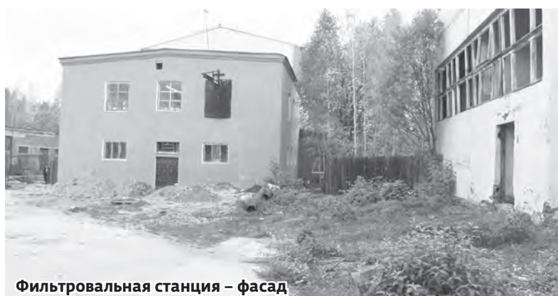
Фильтровальная станция – фасад

комиссии и выбор подрядчика для проведения работ по реконструкции. Подрядчик был определен распоряжением главы по чрезвычайной ситуации (как и многие другие работы), при этом договор подряда был заключен только через месяц, а этого срока недостаточно, чтобы провести полноценный конкурс. Подрядчик основной причиной задержки сдачи объекта называет отказ со стороны районной администрации произвести предоплату. Исходя из разъяснений, данных администрацией района, финансирование данных работ возможно только после сдачи объекта и предоставления полного пакета документов, так как опыт работы по предоплате с предыдущим подрядчиком по тому же объекту нанес бюджету огромный ущерб, предоплату получили, а работы не выполнили.