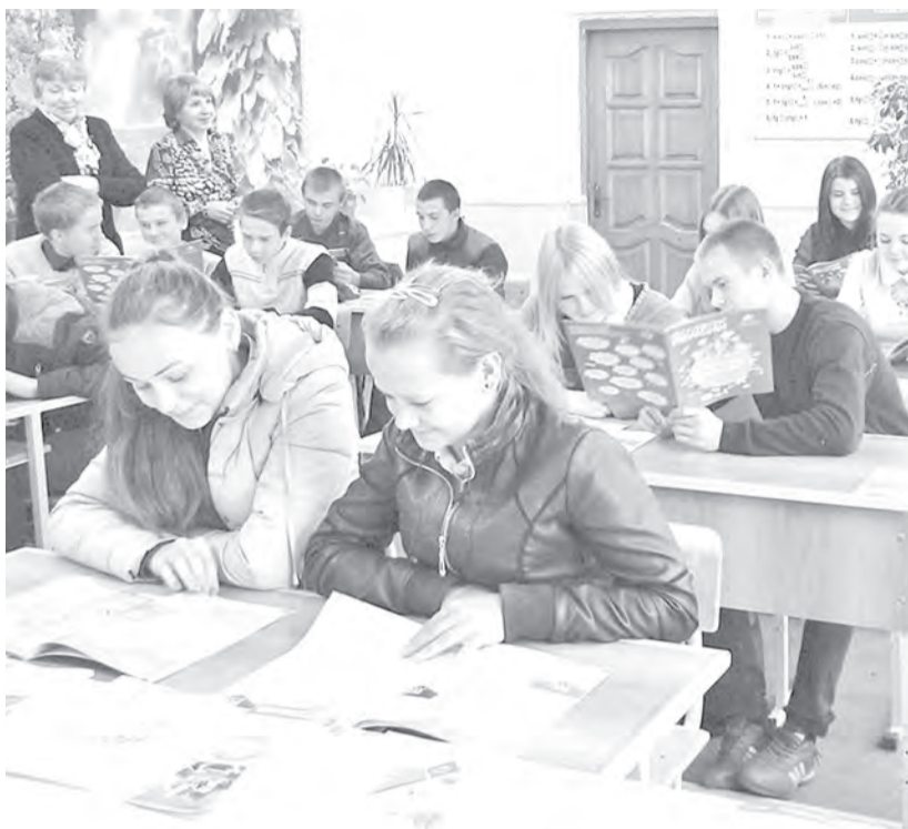
Багарякские школьники с интересом знакомятся с новыми учебными пособиями

Для лучшего восприятия темы сотрудники ПФР презентовали учащимся новые учебные пособия «Все о будущей пенсии