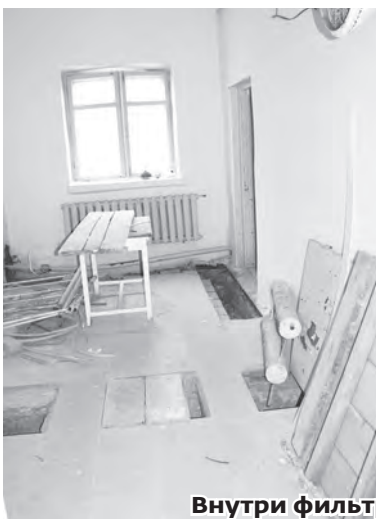
Внутри фильтровальной станции