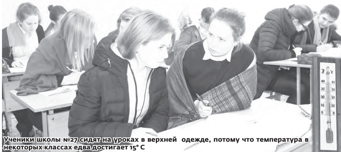
Ученики школы №27 сидят на уроках в верхней одежде, потому что температура в некоторых классах едва достигает 15° С

– Чтобы обеспечить домам гарантированные законом градусы, все дома в Каслях должны