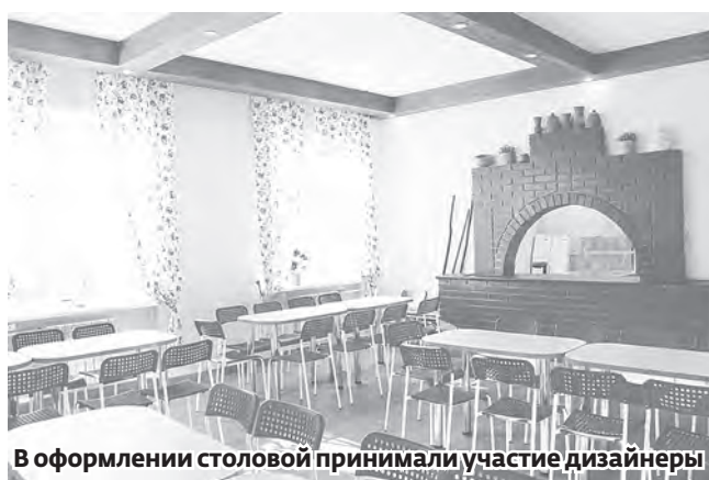
В оформлении столовой принимали участие дизайнеры