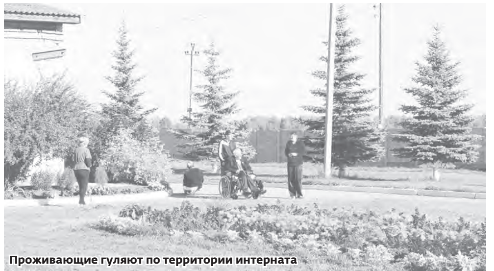
Проживающие гуляют по территории интерната

О рганизацией отдыха и досуга проживающих занимаются три социальных работника и воспитатель. Одна из них – Эльвира Вахитова, работает в досуговом центре интерната, который открылся 15 декабря прошлого года. Воспитатели под её руководством занимаются там разными видами творчества: лепкой из солёного теста, рисованием, аппликацией, оригами, вязанием, изготовлением цветов, поделок из природного материала и т.д. Эльвира называет своих учеников детьми, хотя по возрасту многие из них годятся ей в родители. Ежедневно досуговый центр посещает 40 человек, это 4 группы по 10 человек, которые занимаются по часу. Каждого надо похвалить, для каждого найти доброе слово, потому что они, как дети, испытывают в этом необходимость. У Эльвиры есть свои любимчики. Один из них – Егор, ходит на занятия постоянно. Ему 21 год, он не умеет ни читать, ни писать, но у него хорошо получаются поделки из солёного теста и бумагопластика. Со своими работами он участвовал в выставках. Многие из воспитанников, как Егор, пришли в интернат уже с определёнными навыками и умениями. Все они участвуют