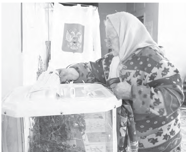
На избирательном участке №930 в день выборов проголосовало более 300 человек. Явка составила 39%