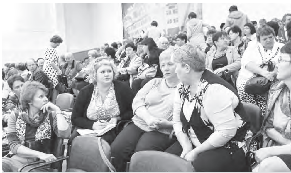
Педагоги и воспитатели перед началом совещания