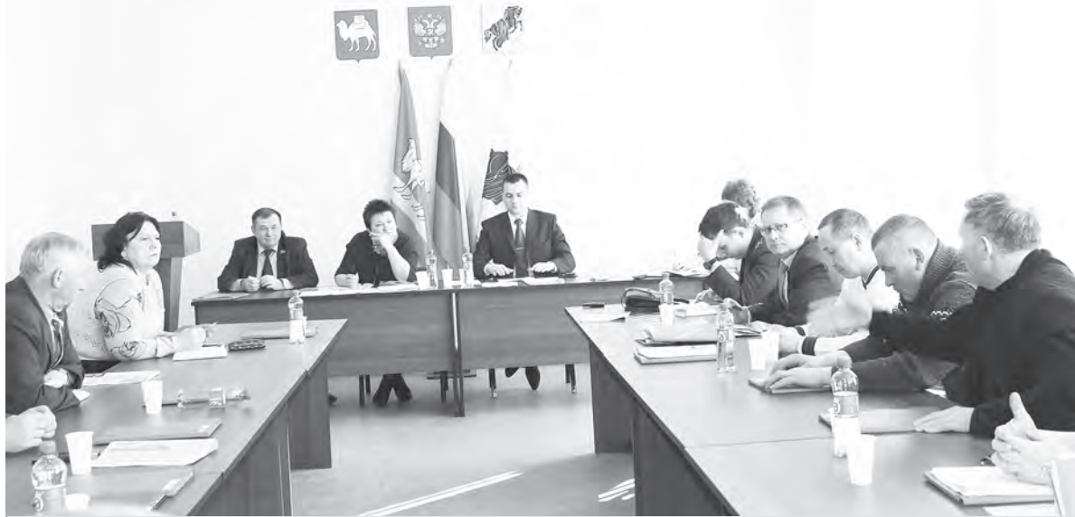
Депутаты района на заседании февральской сессии 2015 года.

Стараясь не обращать внимания на словесные выпады, глава района объяснил, «для того, чтобы попасть в областную программу по газификации, необходимо иметь проектно-сметную документацию, прошедшую госэкспертизу. Готовы проектно-сметные документации на