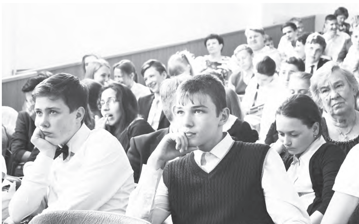
Участниками встречи с депутатом стали и учащиеся городских школ. Наравне со взрослыми старшеклассники включались в диалог, смело задавали вопросы

– Я считаю, что в 9-м классе экзамены имеют право на существование, но только в одном случае, если этот формат будет оправдан последствиями и, если они будут хоть на что-то влиять. Пока же экзамены за основную школу влияют только на самочувствие наших ребят. Если мы действительно хотим принимать в таком формате экзамены, значит, надо четко объяснить детям, зачем они нужны. Уровень стрессовой нагрузки, которому подвергаются наши школьники, на сегодняшний день критический. У меня есть несколько конкретных предложений, реализации которых уже удалось частично добиться. Во-первых, я предлагаю мораторий на внесение изменений в систему ЕГЭ на ближайшие несколько лет. Надо остановиться в этом бесконечном реформи-