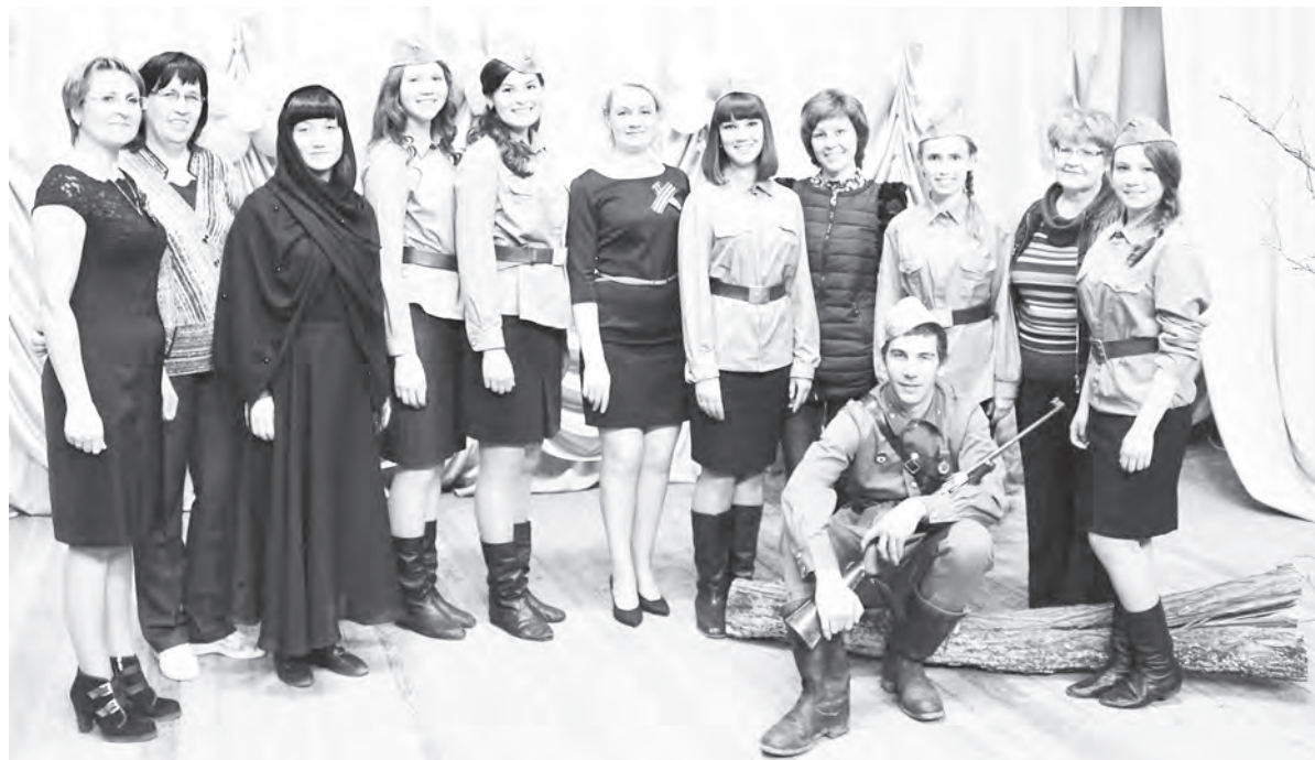
Участники литературно-музыкальной композиции